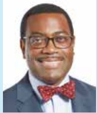
아킨우미 아데시나 (Dr. Akinwumi A. Adesina) 제 8대 AfDB 그룹 총재

AfDB의 10개년 장기전략 (AfDB Long Term Strategy for 2013-2022)은 '포용적 성장'과 '녹색성장'이라는 두 가지 목표에 중점을 두고 있습니다. 아프리카개발은행은 이 목표를 달성하기 위해 인프라 개발, 지역경제통합, 민간부문 개발, 거버넌스, 인적기술과 테크놀로지를 중심으로 사업의 과제를 내걸고 있습니다. 2015년 5월에 열린 'AfDB 연차총회'에서 아킨우미 아데시나 전 나이지리아 농업부 장관이 제8대 아프리카개발은행 총재로 선출되었습니다. 아데시나 총재는 2015년 9월 1일 취임하여 5년 간의 임기를 시작했습니다. 아데시나 총재는 AfDB의 중장기적인 운영 방향인 '5대 중점분야(High-5s)'를 발표했습니다. 이는 '10개년 장기전략'의 연장선 상에 있으며, 아프리카 대륙의 핵심 개발 과제들을 담고 있습니다.