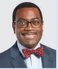
아킨우미 아데시나 (Dr. Akinwumi A. Adesina) 제8대 AfDB 그룹 총재

2015년 5월에 열린 AfDB 연차총회에서 아킨우미 아데시나 아데시나 전 나이지리아 농업부 장관이 제8대 아프리카 개발은행 총재로 선출되어 2015년 9월 1일부터 5년간의 임기를 시작했습니다. 아데시나 총재는 AfDB의 중장기적인 운영 방향인 「5대 중점 분야(High-5s)」를 발표하였고, 이는 「10개년 장기전략」의 연장선 상에서 아프리카 대륙의 핵심 개발 과제를 담고 있습니다.